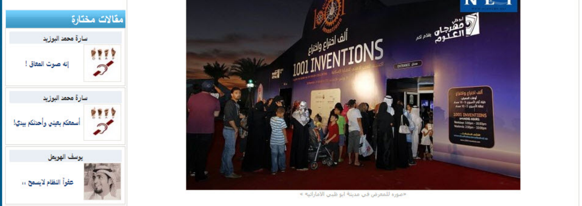
«صورة للمعرض في مدينة أبو ظبي الاماراتية»